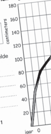
Grafiek 1 gemiddelde lengte

b. Verwerk de gegevens uit grafiek 1 in de tabel.